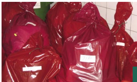
Infekční odpad je v Karvinské hornické nemocnici shromažďován v určeném prostoru.

Vyhláška 383/2001 o podrobnostech nakládání s odpady uvádí: