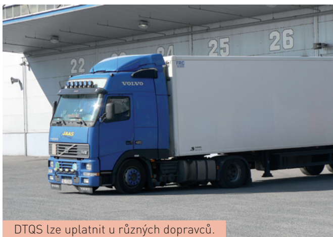
DTQS lze uplatnit u různých dopravců.

Přilákání zákazníků na nižší dovozní oproti konkurenci není tou správnou volbou. Pořízení cisternového vozidla